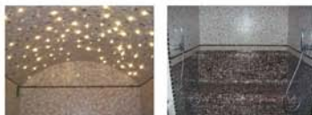
Foto BAGNO TURCO: particolare del soffitto con cielo stellato e sedute.

N.B.: Si precisa che date le caratteristiche architettoniche del locale da adibire a centro benessere, gli elementi proposti dovranno essere realizzati su misura in modo da integrarsi con il contesto.