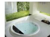
Foto VASCA IDROMASSAGGIO