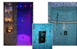
Foto DOCCE EMOZIONALI e particolare pulsantiera.